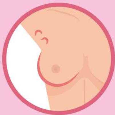
Боль как в молочной железе, так и в сосках