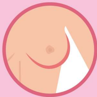
Изменение формы и втягивание соска

ВАЖНО! «Нулевая» и «первая» стадии рака выраженных симптомов не имеют