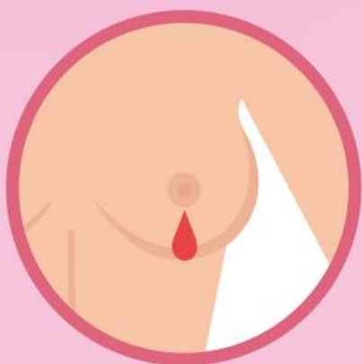
Выделения из молочной железы