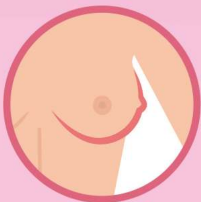
Уплотнения в груди, спаянные с окружающими тканями